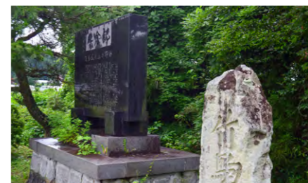
改良区の歴史が書かれた記念碑