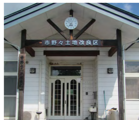
市野々土地改良区事務所

また、会計作業時間は半減しました。おかげで基盤整備事業の方に十分時間が割けています。ミラウド上のデータはExcelに簡単にダウンロードできるので、土地台